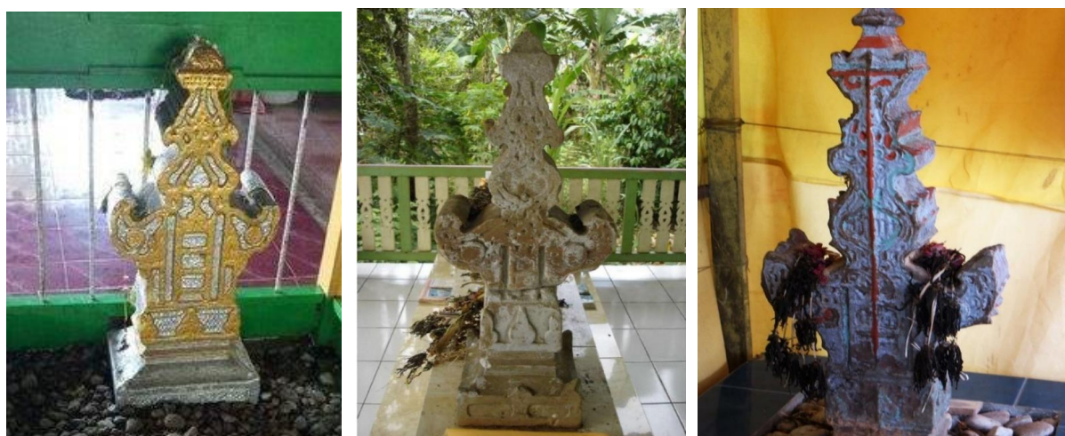
Gambar 1. Ragam hias pada Makam Sultan Suriansyah (kiri), Sultan Mustain Billah (tengah) serta Sultan Inayatullah (kanan).

Kemudian dari ragam hias makam awal Sultan Banjar beragam serta dapat ditinjau dalam perbandingan. Seperti Makam Sultan Suriansyah, Sultan Banjar pertama. Ragam Hias berupa Atang dari kayu diukir motif bunga, pancar matahari dan pucuk rabung. Jirat dari kayu ulin diukir motif stilasi kuncup bunga sebanyak empat buah dengan warna hijau dan kuning. Dahi jirat berornamen aktif motif flora berkerawang. Kisi kisi jirat dari besi dicetak motif flora dan simetris warna silver. Nisan dari batu dengan alam yang ditatah bermotif bingkai cermin dan dicat warna kuning emas.