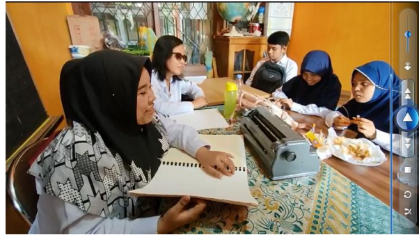
Gambar 4. Guru Memberikan Arahan pada Siswa

Guru : Panjang sisi persegi nya berapa? Luas persegi rumusnya apa?