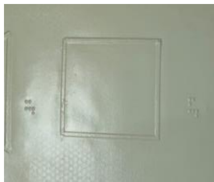
Gambar 1. Bentuk Persegi

Pada kegiatan inti, siswa mendengarkan penjelasan guru tentang materi persegi. Guru kemudian memberikan penjelasan awal tentang bangun datar persegi. Guru kemudian memberikan penjelasan lebih lanjut mengenai bentuk persegi dengan menggunakan bantuan buku Braille .