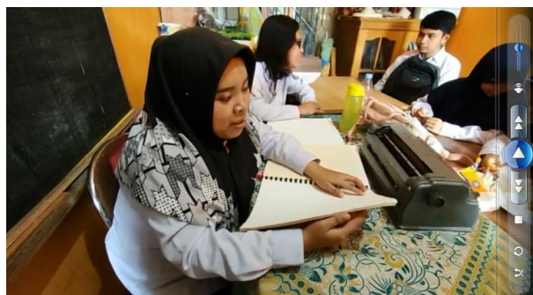
Gambar 3. Guru Membacakan Soal pada Buku Braille

Guru : Misalkan sebuah persegi memiliki panjang sisi 5 cm, berapa luasnya?