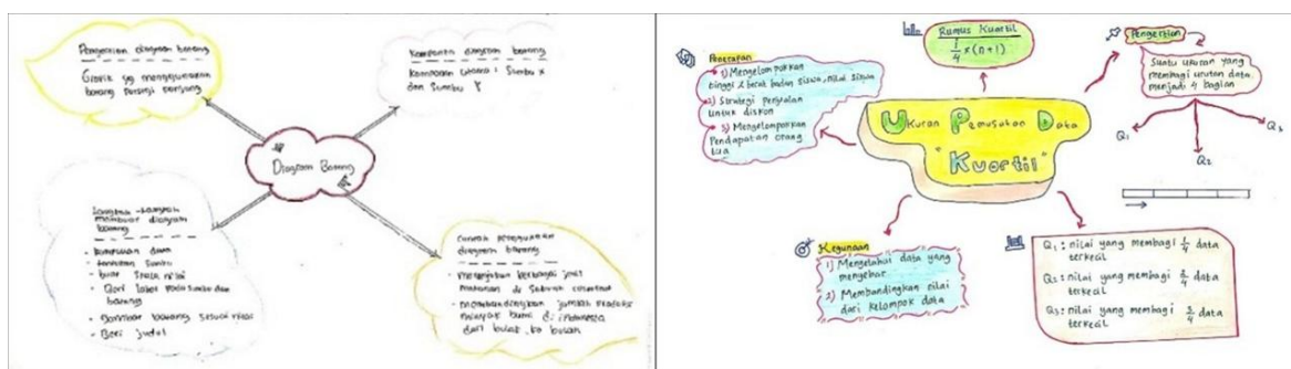
Gambar 2. Hasil mind map siswa

Konsep kreativitas visual Munandar menjadi acuan dalam mengamati mind map siswa dari aspek keterhubungan ide, susunan informasi, pengelompokan, keunikan, dan warna (Batara, 2022). Mind map yang disusun siswa selama pembelajaran mencerminkan perkembangan kemampuan mereka dalam mengaitkan konsep matematika. Pada Gambar 2 terlihat bahwa mind map diagram batang mencantumkan ide-ide yang masih sederhana, misalnya hanya menuliskan komponen dasar seperti sumbu X dan Y, serta sedikit contoh penggunaan. Berbeda halnya dengan materi kuartil di akhir pembelajaran, siswa mampu membuat mind map yang lebih lengkap, memuat konsep kuartil, rumus perhitungan, dan penerapannya dalam beberapa konteks seperti data tinggi dan berat badan, strategi diskon, serta pendapatan keluarga. Penerapan tersebut relevan tidak hanya dalam bidang matematika, tetapi juga berkaitan dengan disiplin ilmu lain seperti ekonomi. Hal ini menunjukkan bahwa mind map membantu siswa memetakan pengetahuan secara lebih terstruktur dan memperluas keterhubungan antar konsep dalam berbagai situasi nyata.