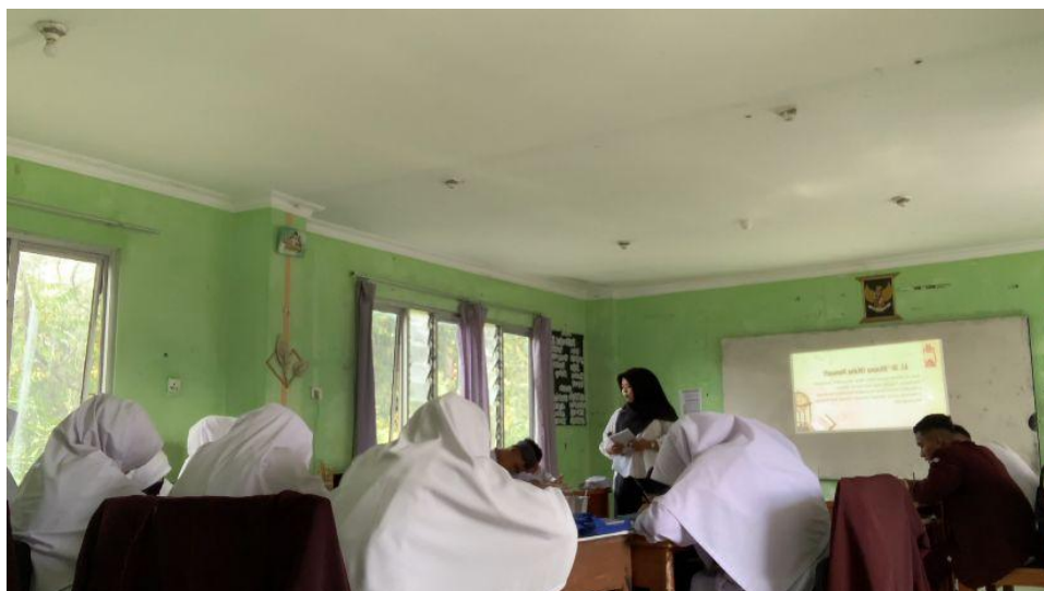
Gambar 1. Observasi kelas

memperlihatkan suasana kelas saat mahasiswa melakukan observasi pertama untuk melihat keadaan santri di dalam kelas.