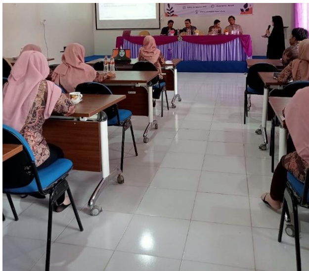
Gambar 1. Pemaparan materi

Pelatihan software manajemen referensi Zotero dilakukan di Sekolah Menengah Pertama Negeri 2 (SMPN 2) Sepaku Kalimantan Timur. Kegiatan dimulai dengan pengenalan software manajemen referensi dan dilanjutkan dengan praktik instalasi dan cara menggunakan aplikasi Zotero. Materi yang disampaikan dibagi menjadi 2 sesi. Materi yang disampaikan pada sesi pertama mengenai pengenalan software manajemen Zotero dan tujuan menggunakan software manajemen referensi Zotero. Sesi 2 dari kegiatan yaitu praktik menginstal dan menggunakan aplikasi Zotero.