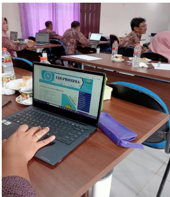
Gambar 2. Praktik penggunaan Zotero

Pada Gambar 1, peserta terlihat antusias dalam mendengarkan penjelasan dari Tim PkM. Beberapa peserta juga mengapresiasi dengan memberikan pertanyaan seputar software manajemen referensi Zotero dan kendala yang dihadapi saat melakukan instalasi dan penggunaan aplikasi Zotero.