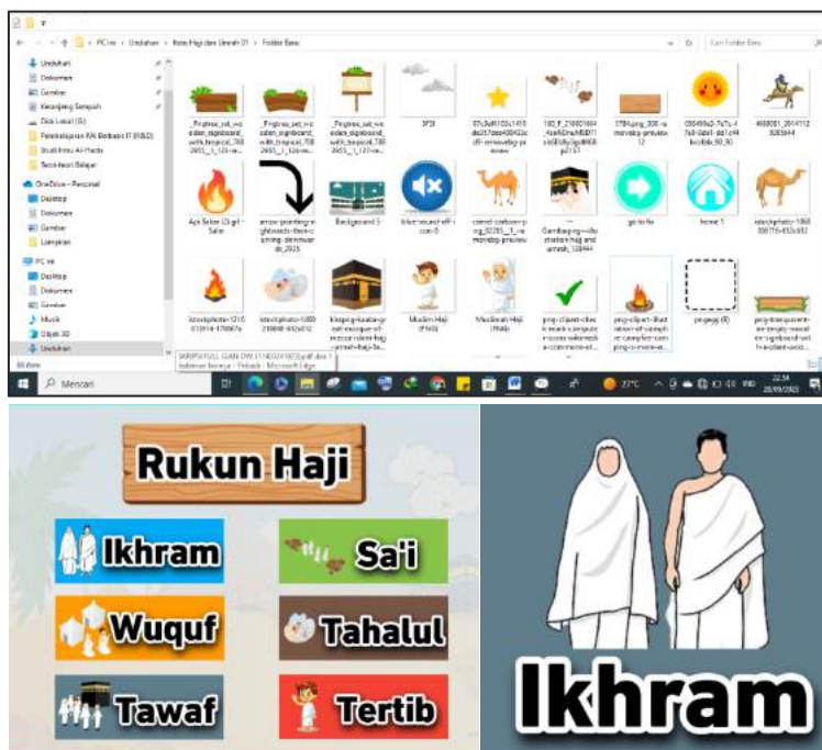
Gambar 1. Kumpulan icon , font , dan gambar pada aplikasi berformat png. gif.

Background , gambar, dan ikon yang ditampilkan dalam media sebagian dirancang sendiri oleh peneliti. Pengombinasian gambar menjadi tampilan yang menarik diunduh dari berbagai sumber. Pengumpulan gambar, font dan tombol sebagian besar diunduh dari laman Google Image. Pembuatan dan pengombinasian gambar dilakukan dengan bantuan PicsArt , remove.bg , dan Unscreen . Gambar berformat jpg., png., dan gif., dikombinasikan dan dipadukan sehingga menghasilkan tampilan yang menarik.