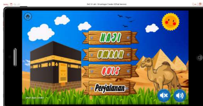
Gambar 3. Tampilan Menu Awal

Langkah kedua adalah membuat menu utama aplikasi Smart Apps Creator (SAC) yang terdiri dari empat menu, dan masing-masing mempunyai fungsi yang berbeda. Empat menu tersebut adalah 1) Materi Haji; 2) Materi Umrah; 3) Latihan; dan 4) Ringkasan Perjalanan Haji dan Umrah. Pada bagian bawah menu terdapat icon on dan off background voice yang berfungsi untuk mengaktifkan dan menonaktifkan musik.