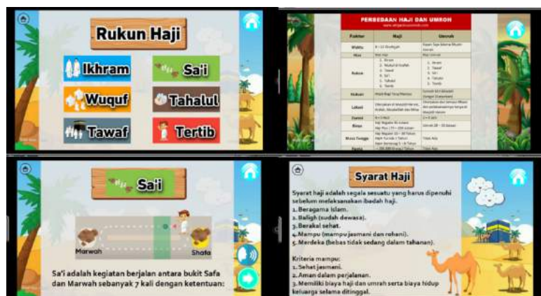
Gambar 5. Tampilan Materi Haji dan Umrah

Langkah Keempat adalah membuat menu materi pelaksanaan umrah yang terdiri dari enam menu, dan masing-masing mengandung materi yang berbeda. Enam menu tersebut terdiri dari (1) Pengertian Umrah, (2) Rukun Umrah, (3) Syarat Umrah, (4) Sunah Umrah, (5) Larangan Umrah, dan (6) Perbedaan Umrah dan Haji. Pada bagian kanan atas menu terdapat ikon on dan off background music yang berfungsi untuk mengaktifkan dan menonaktifkan musik. Kemudian terdapat menu home yang berfungsi untuk kembali ke halaman menu awal.