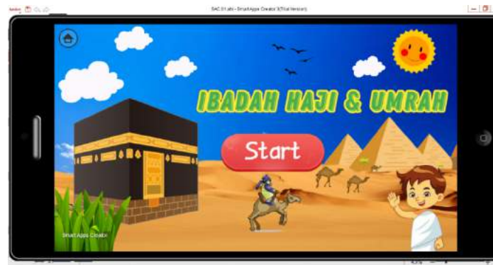
Gambar 2. Tampilan Loading Screen

Langkah pertama adalah membuat loading screen sederhana dengan dikombinasikan background , gambar, dan ikon. Terdapat tombol Start berwarna merah yang jika diklik akan terhubung pada menu awal aplikasi.