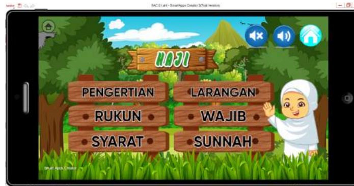
Gambar 4. Tampilan Menu Haji