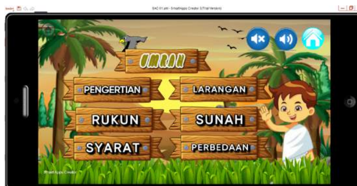
Gambar 6. Tampilan Menu Umrah

Langkah Keempat adalah membuat menu materi pelaksanaan umrah yang terdiri dari enam menu, dan masing-masing mengandung materi yang berbeda. Enam menu tersebut terdiri dari (1) Pengertian Umrah, (2) Rukun Umrah, (3) Syarat Umrah, (4) Sunah Umrah, (5) Larangan Umrah, dan (6) Perbedaan Umrah dan Haji. Pada bagian kanan atas menu terdapat ikon on dan off background music yang berfungsi untuk mengaktifkan dan menonaktifkan musik. Kemudian terdapat menu home yang berfungsi untuk kembali ke halaman menu awal.