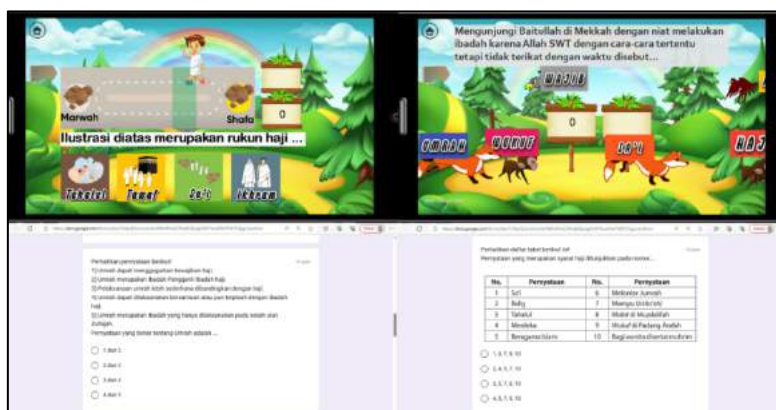
Gambar 8. Tampilan Game dan Quiz